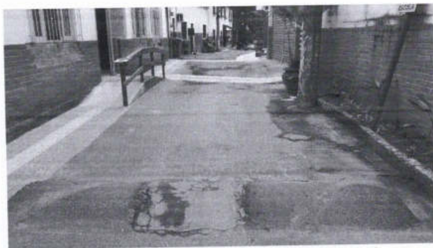
Nesta VISADA, local do quebra-molas existente – observar em planta a execução de outro quebra-molas, pisos e jardineiras.