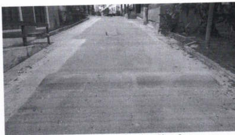
Via de Acesso, à esquerda, o Bloco 9.