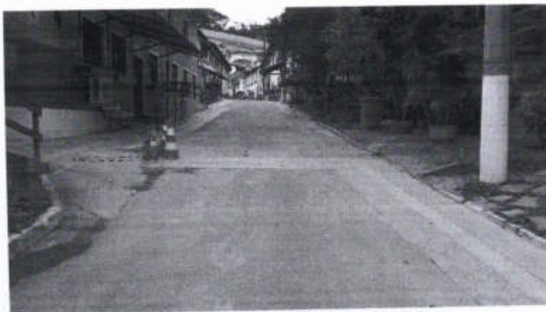
Via de Acesso, à esquerda, o Bloco 9.