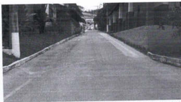
Foto da Via de Acesso, à esquerda, o Bloco 7, e à direita, da extremidade do Bloco 8.

Recentemente foram executados diversos calçamentos, rampas, pisos cerâmicos e pisos táteis formando percursos sinalizados de acesso aos referidos blocos. Desta forma, as intervenções deste escopo devem considerar estas calçadas/rampas existentes, e o devido cuidado nas demolições que permanecerão nos perímetros e áreas contíguas à estas calçadas/rampas.