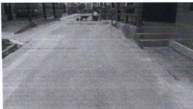
Via de acesso, a esquerda início do Bloco 12 e à direita o Bloco 13.