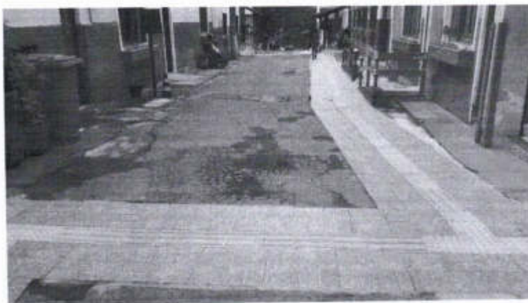
Via de acesso, COM VISÃO OPOSTA, à esquerda o Bloco 13 e à direita o Bloco 12.