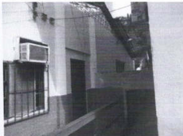
Vista da fachada lateral, com o tipo de telha existente, as duas águas, cumeeira.