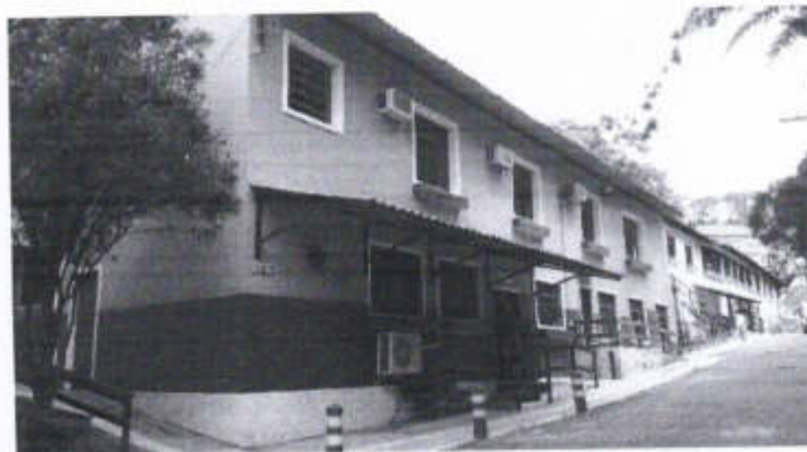
Fachada frontal da via principal, uma das águas da cobertura existente.

Logo abaixo, uma vista da cobertura existente: