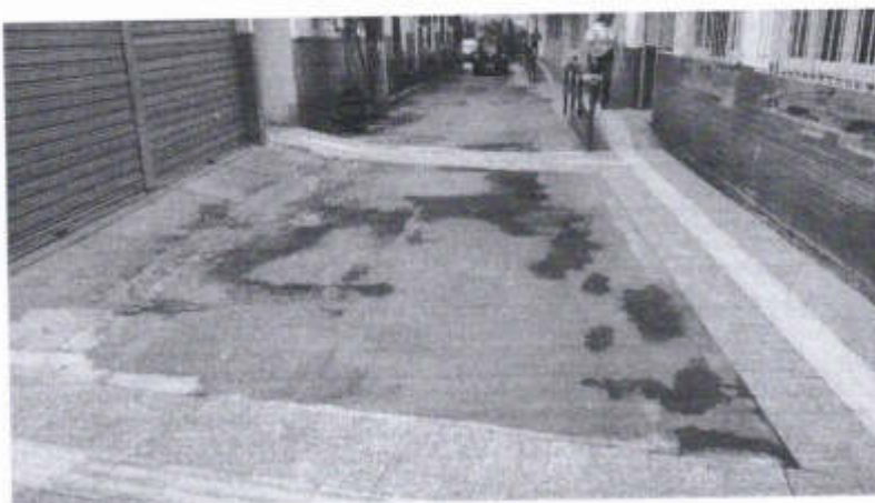
Via de acesso, COM VISÃO PARA O FINAL DA VIA, à esquerda ainda o Bloco 12, local da cantina - à direita o Bloco 13/17.