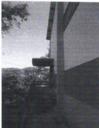
Bloco 18 – utilização de sua cobertura existente para a montagem de parte do Sistema Fotovoltaico.