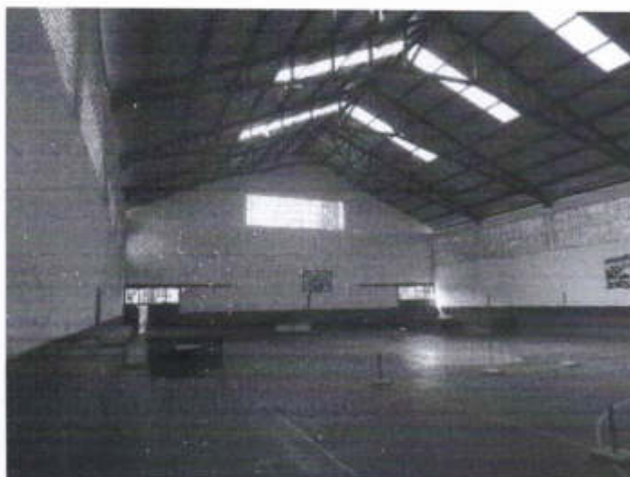
Bloco 18, interna do Ginásio, indicado todo telhado apoiado sobre estrutura metálica.