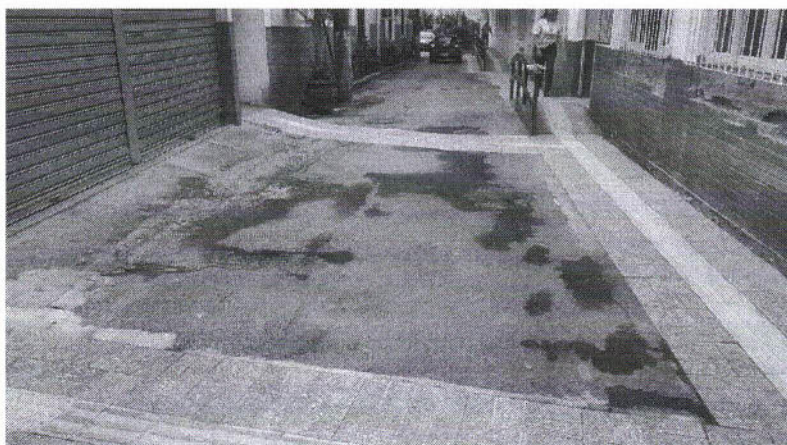
Via de acesso, COM VISÃO PARA O FINAL DA VIA, à esquerda ainda o Bloco 12, local da cantina - à direita o Bloco 13/17.