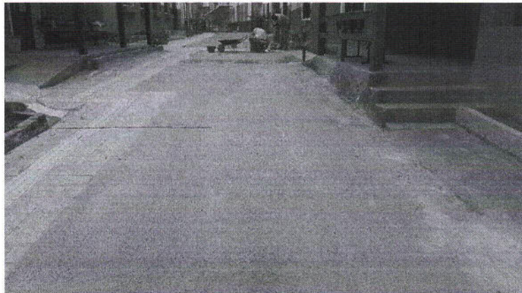
Via de acesso, a esquerda início do Bloco 12 e à direita o Bloco 13.

1 - Adaptação dos locais indicados em planta para a execução de piso intertravado e cimentado.