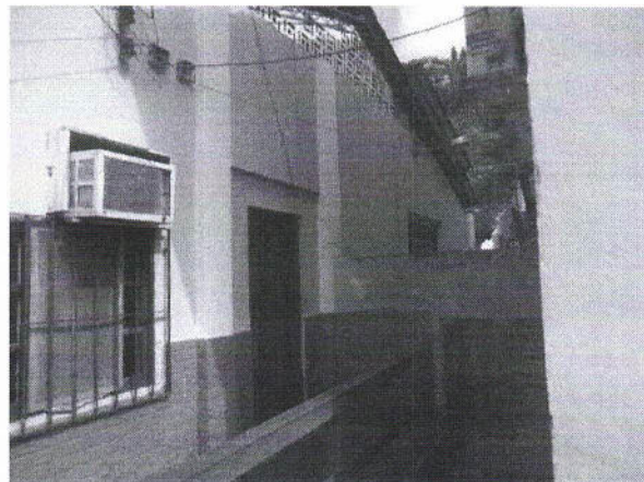
Vista da fachada lateral, com o tipo de telha existente, as duas águas, cumeeira.