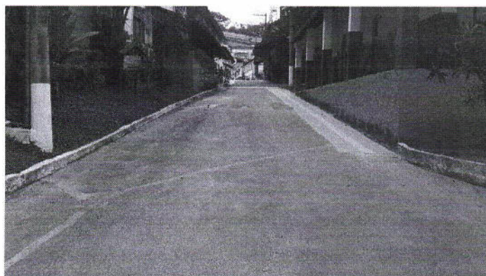
Foto da Via de Acesso, à esquerda, o Bloco 7, e à direita, da extremidade do Bloco 8.

Recentemente foram executados diversos calçamentos, rampas, pisos cerâmicos e pisos táteis formando percursos sinalizados de acesso aos referidos blocos. Desta forma, as intervenções deste escopo devem considerar estas calçadas/rampas existentes, e o devido cuidado nas demolições que permanecerão nos perímetros e áreas contíguas à estas calçadas/rampas.