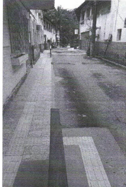
Invertendo a VISADA, o mesmo trecho – blocos 16 e 17.