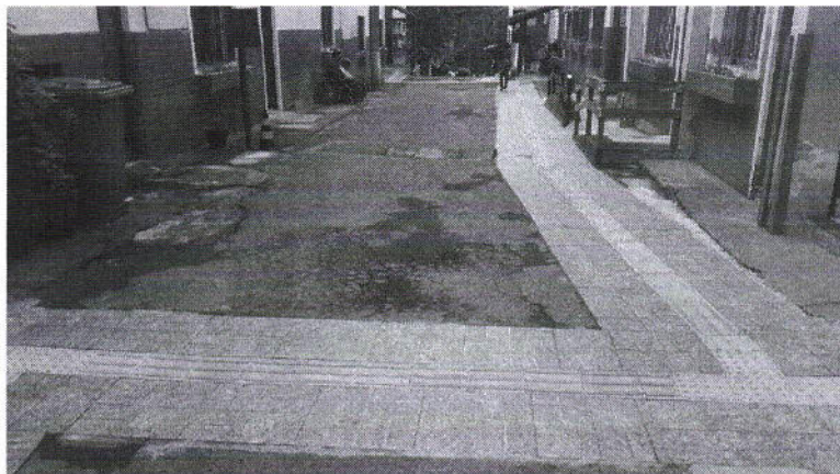
Via de acesso, COM VISÃO OPOSTA, à esquerda o Bloco 13 e à direita o Bloco 12.

1 - Adaptação dos locais indicados em planta para a execução de piso intertravado e cimentado.