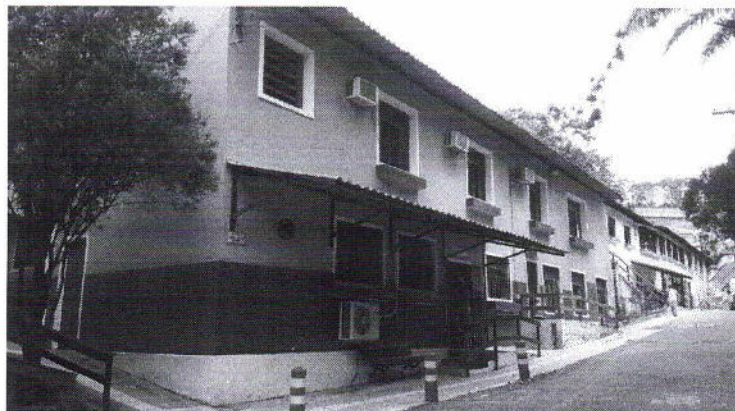
Fachada frontal da via principal, uma das águas da cobertura existente.

Logo abaixo, uma vista da cobertura existente: