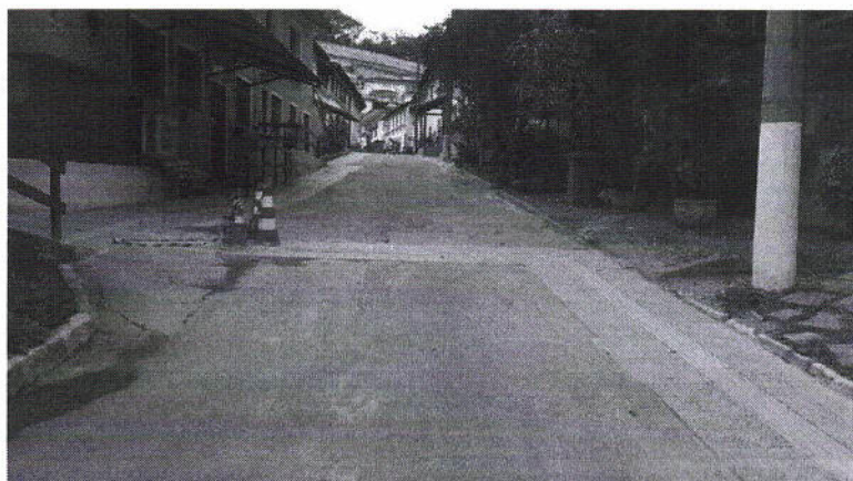
Via de Acesso, à esquerda, o Bloco 9.